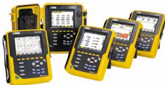
Chauvin-Arnoux instrument för beräkning av K-faktor (FHL): CA8331, CA8333, CA8336 samt CA8436.

Bilden ovan visar en typisk kurva definierad enligt ANSI/IEEE C57.110 standard.